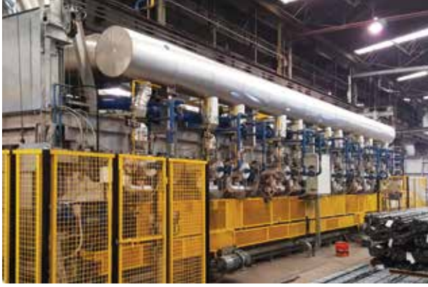
Yığıma Tip Isıl İşlem Fırını