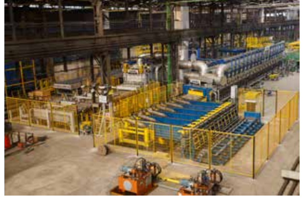
Kontinü Tip Isıl İşlem Fırını