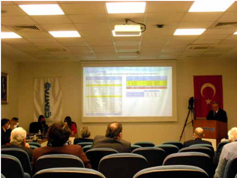
2020 YILINA AİT GENEL KURUL TOPLANTISI