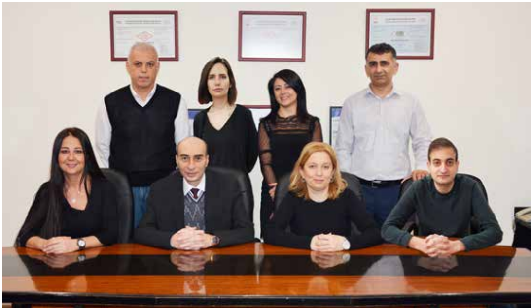
Finans - Muhasebe