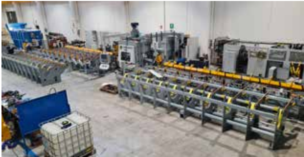
Kabuk Soyma Hattı